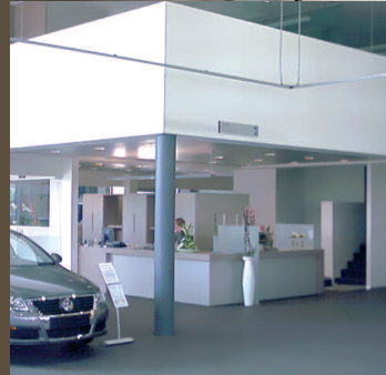
Garage Cook-Meyers, Hasselt