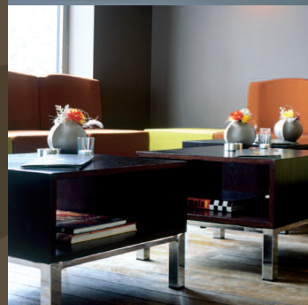
De Pils, Zolder