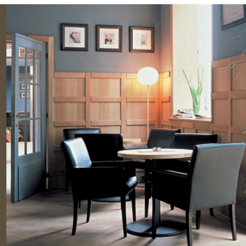
De Oude Kamelen, Haverlee

Sint-Trudostraat 59 | 3990 Peer | tel. 011 63 67 00 | fax 011 63 67 10 accent.interieur@euphony.net.be | www.accent-interieur.be