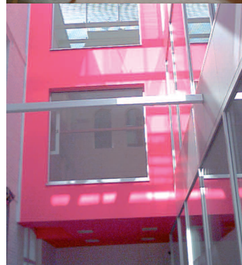
Theo Eyewear, Antwerpen